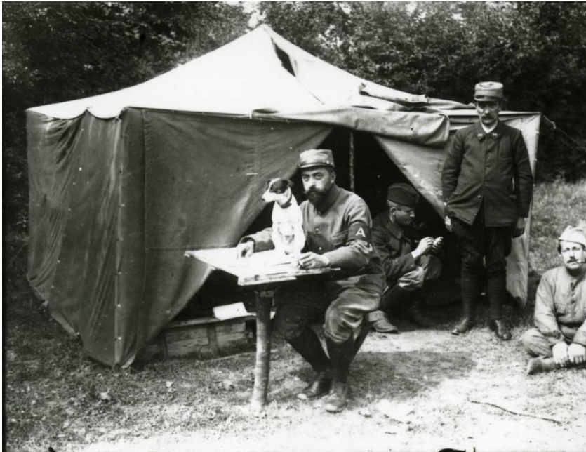
Aubigny-en-Artois durant la première guerre mondiale : soldats posant devant leur tente. Photographie en noir et blanc, 1914-1918.

Comment appelle-t-on les animaux considérés comme porte-bonheurs ou symboles par un groupe de personnes ?