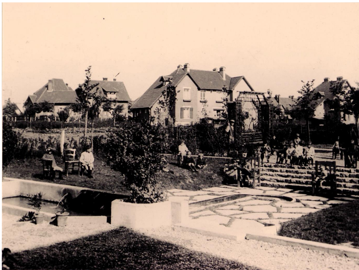
Archives départementales, 5 Fi 510/54

Que représente le document sur le panneau 14 et qui porte la cote 8 Fi 635 ?