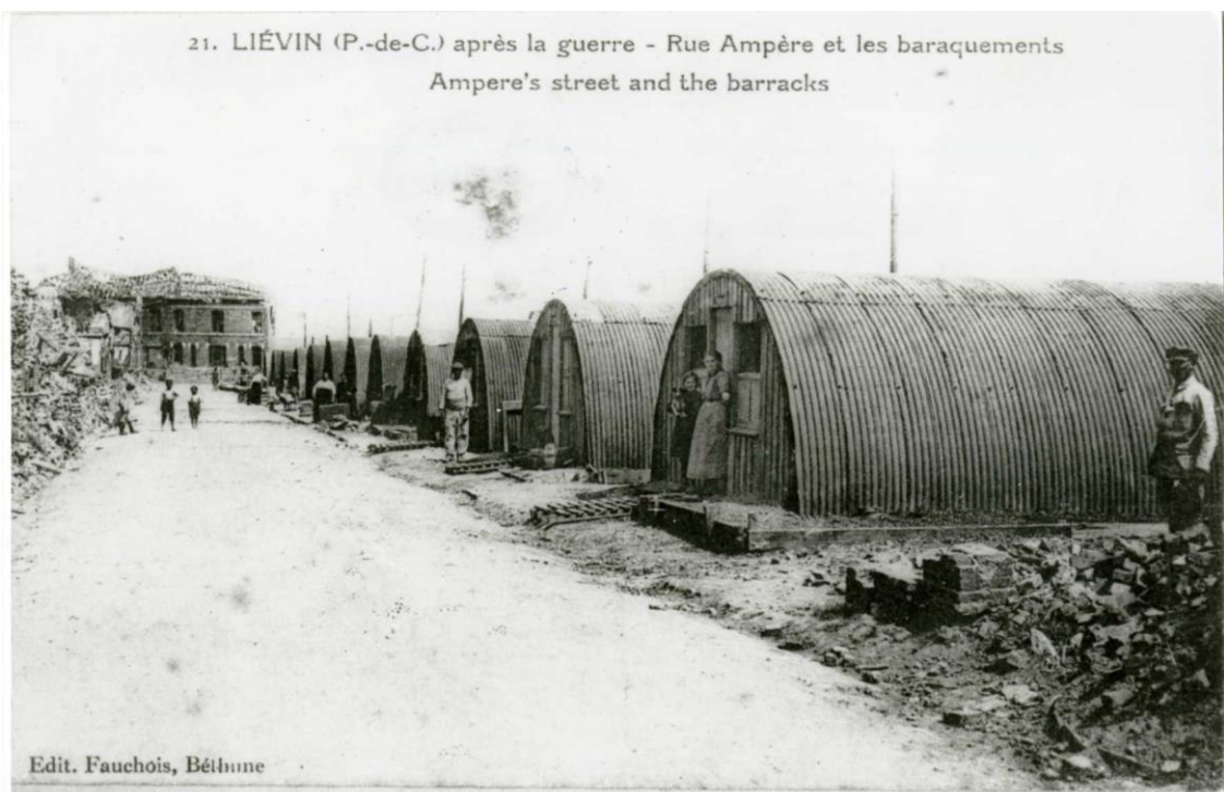
Archives départementales, 5 Fi 510/54