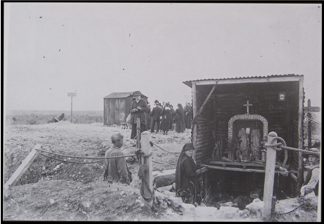
Archives départementales, 36 Fi 279

La victoire de 1918 n'occulte pas le deuil et la douleur qui planent au-dessus des populations survivantes avec la volonté de rendre hommage aux « glorieux défunts » : hommage individuel mais aussi collectif. Les manifestations de ce deuil se font jour dès la victoire avec les pèlerinages en vue de se recueillir sur les lieux des sépultures et l'apparition du tourisme de mémoire.