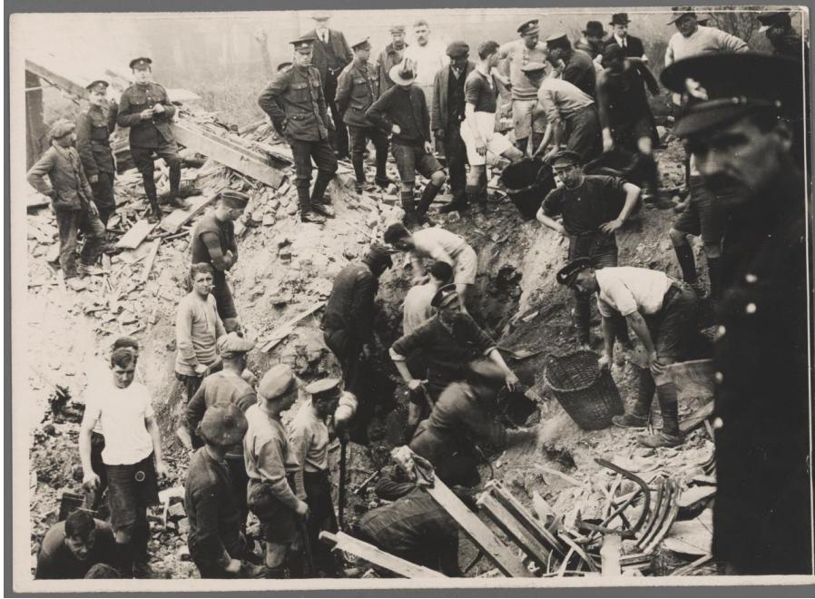
Archives départementales, 8 Fi 1092

Dans quel état les habitants des villes et des villages de l'Artois retrouvent-ils leurs habitations ?