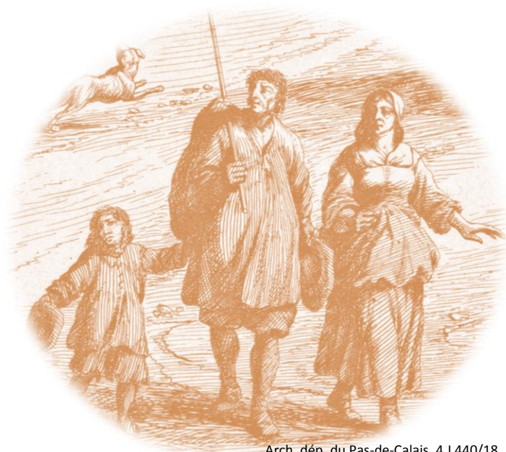
Arch. dép. du Pas-de-Calais, 4 J 440/18

Le saviez-vous ? À la veille de la Révolution, la consommation de pain est très importante. En moyenne, un homme mange 1 kg de pain par jour, les femmes et les enfants, 750 g ! Sachant qu'il faut 1 kg de blé pour faire 1 kg de pain.