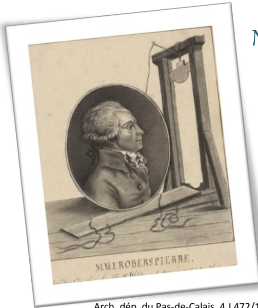
4 J 472/181